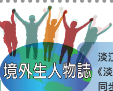
淡江時報與淡江之聲FM88.7 《淡江地球村，境外生心聲》 同步刊播

設計思考坊助2020泰度重啓 課外組於12月9日為寒假即將啓程的泰國服務學習團安排設計思考坊，邀請臺大創新設計學院來校演講。(文/李羿璇)