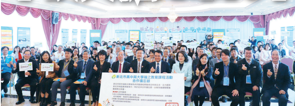
▲淡江教務所與新北教育局推動高中與大學「共備課程、共創學習」論壇，並簽訂「新北市高中與大學端之教育課程活動合作備忘錄」，正式啟動合作機制。(圖/教務所提供)

【記者周浩豐淡水校園報導】108學年對全臺教育界是新局，因為十二年國教新課綱啟動。為此，教務所與新北教育局、新北市新課綱行動協作平臺，在覺生國際會議廳合辦「新課綱加速器—攜手與領航：大學與高中共備課程、共創學習實務推動論壇」，包括學術副校長何啓東、新北市政府教育局局長張明文、教育部高教司招生助學科長郭佳音、教務所講座教授吳清基、教育學院院長潘慧玲及教務所所長薛雅慈等，還有近200位關心新課綱的學者及新北市近30所高中代表與會。