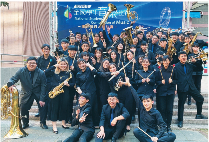
▲管樂社在 110 學年度全國學生音樂比賽北區決賽勇奪「管樂合奏一大專團體 B 組」特優，大家於會場外開心合影。

【記者姚富淡淡水校園報導】本校音樂性社團參加 110 學年度全國學生音樂比賽北區決賽捷報連連，為校囊括 1 特優 3 優等 1 甲等獎項。管樂社精彩的演奏屢受肯定，蟬聯多年「管