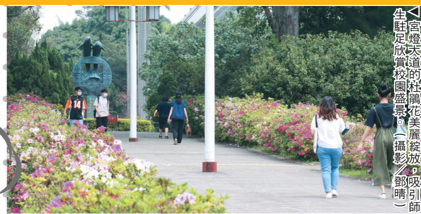
▲宮燈映襯的校園盛景。(攝影/鄧晴)