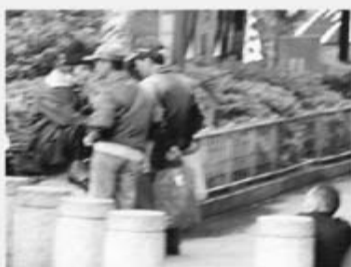
Fig. 2 Homeless people wander around and gather together for chatting.

The favorite haunt for the homeless people is Longshan Temple in Wanhua District. Some of them group around the street to exchange daily information.