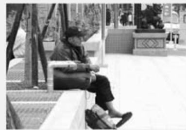
Fig. 3 A homeless man sits by the sidewalk with his sleeping bag and personal belongings packed in a small luggage.