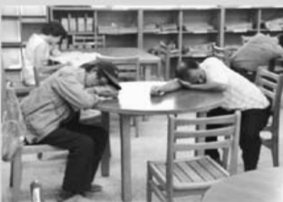
Fig. 5 Homeless people nap in the reading area in a public library.