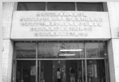
Fig. 4 For the homeless, public libraries provide ideal shelters.

Various factors make public libraries the best day shelter for the homeless people. Public libraries are cozy, safe, as well as quiet, and more importantly, it is a public space open to all.