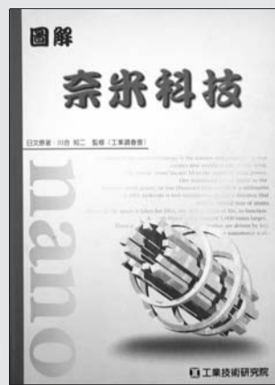
圖解奈米科技 編輯 川合知二 出版社 工業技術研究院

21世紀全球均非常重視奈米科技的研發，它正在改變與人類發展息息相關的產業，如資訊、生物、醫療、能源、半導體工業等，至於奈米是啥米，是值得瞭解的常識，謹介紹一本科普書：《圖解 奈米科技》。書中以易懂的圖解，深入浅出地說明奈米科技，共5章：奈米科技打開明日之窗；新進材料素領域的奈米科技；奈米科技之加工量測；以產業別看奈米科技和未來之展望等。奈米尺寸的物品無法用肉眼看到，人的高度是以米 (公尺) 計，DNA以奈米為單位，這兩者比例就像是地球相較於一顆乒乓球。材料的性質是由原子、分子和奈米等級結構控制，如鑽石、碳簇、奈米碳管或石墨等，是不同排列的碳原子組成，所造成材料的應用性質和價值截然不同。