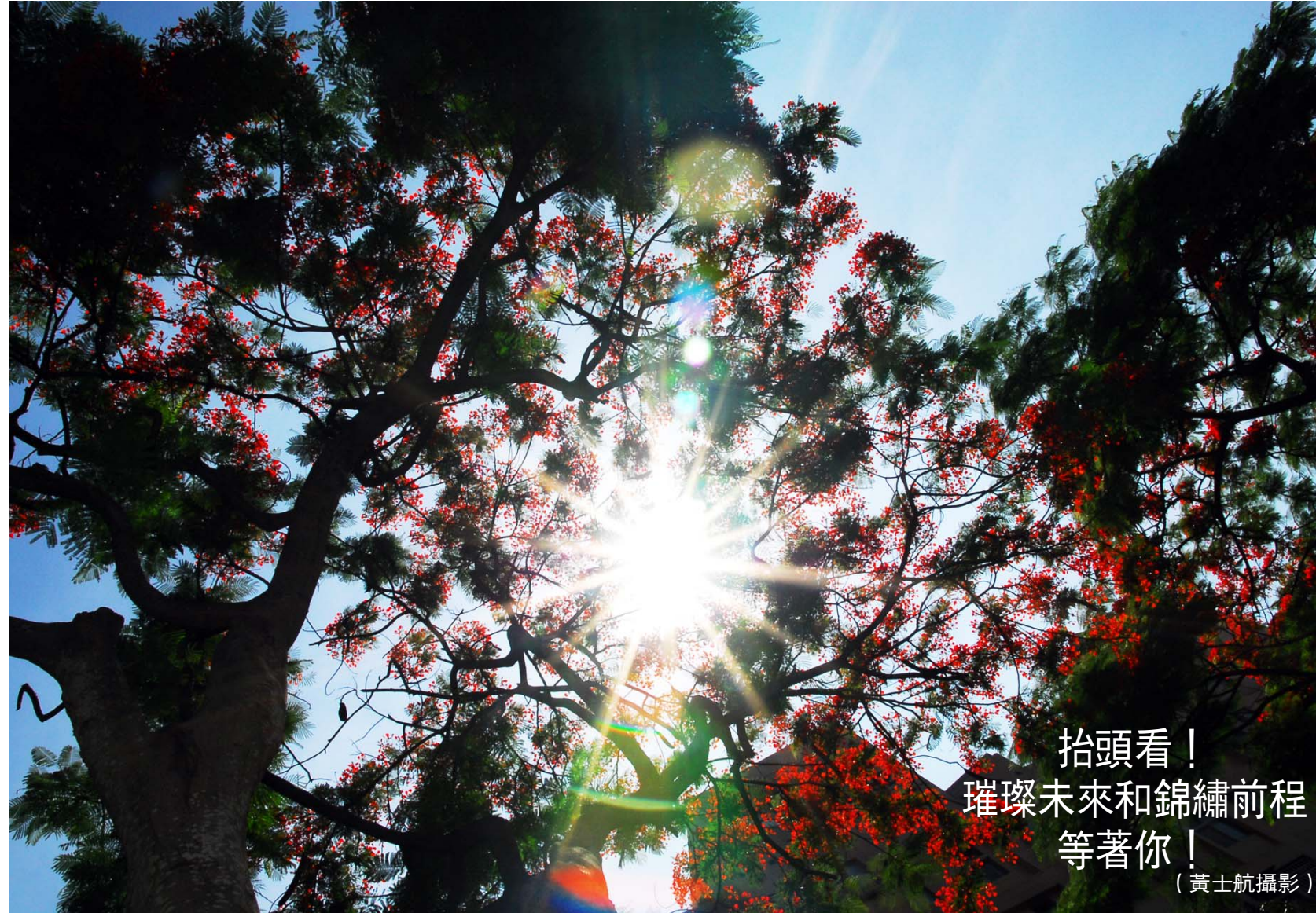
抬頭看！璀璨未來和錦繡前程等著你！

優朗這段日子我，現在面對著憂鬱、打的即是即將離開學校的畢業感，感覺有點太真實。時間的母校將我們由大學新鮮人對出校園之外。