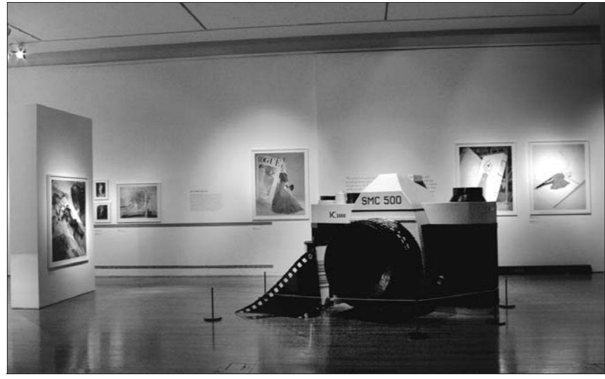
編者按：本文作者曾任本報攝影記者，出國後善用攝影專長，記錄留學生生活點滴，本刊特別刊載其部份作品與讀者分享。

音樂劇可說是英國人的精神糧食，即使是上演的劇目，都充滿了名義難求。除了上網訂票，還可以去半票票房排隊購買，願樂劇都有自己戲院，看哪一齣戲院，看哪一齣戲院，也因此舞台設計都非常有特色，有專屬的舞台、燈光、造景，也因此舞場換景也非常迅速，看起戲來非常過癮。開演前一小時，舞台撤戲院前必定大排長龍，有時連人行道都擠得水洩不通。