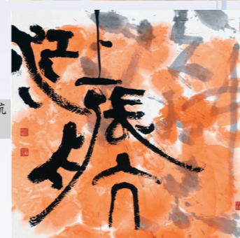
淡中小品 江上長航 張炳煌/書法