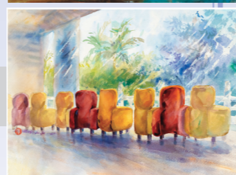
排排座 (淡大圖書館) 張瑞瑜/水彩