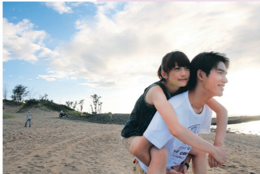
《那些淡江教我們的事》片中之男女主角。

當天首播這場甲子之戲,訴說了學校人事物的縮影,光陰倒流的現場人情溫馨,濃濃的感傷氣氛讓許多人紅了眼眶,無論是提著公事包趕來的、拄著拐杖的資深校友看著影片都說「好想回淡江看看」、「如果能回到當學生的時後……」。淡江的自由跟美麗,讓所有人難以忘懷。(文/林姍亭)