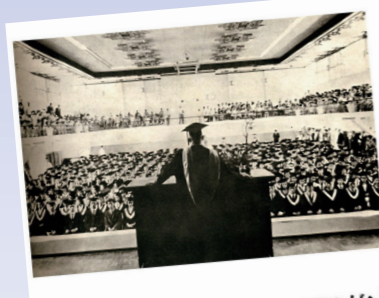
那些淡江教我們的事

淡江大戲—《那些淡江教我們的事》於10月26日下午2時,在台北信義誠品6樓舉辦記者會暨發表會,齊聚學校教職員工及校友近200人。本片由已獲4座金鐘獎的今年金鐘獎最佳戲劇導演獎得主陳慧翎、創作力豐厚獲3座金鐘獎的導演楊雅喆、拍攝《台灣棒球百年風雲—台灣之光》、《星光傳奇》等紀錄片的導演許明暉、3位導演以各自擅長的影像表現方式,詮釋大學4年短暫時光在他們心中所烙印的回憶與影響。