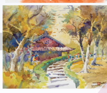
秋意淡江 張旭光/水彩