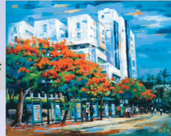
覺生紀念圖書館 郭掌從/油畫