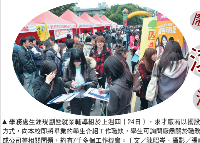
▲學務處生涯規劃暨就業輔導組於上週四(24日)，求才廠商以擺設攤位的方式，向本校即將畢業的學生介紹工作職缺，學生可詢問廠商關於職務、產業或公司等相關問題，約有7千多個工作機會。(文/陳昭岑)