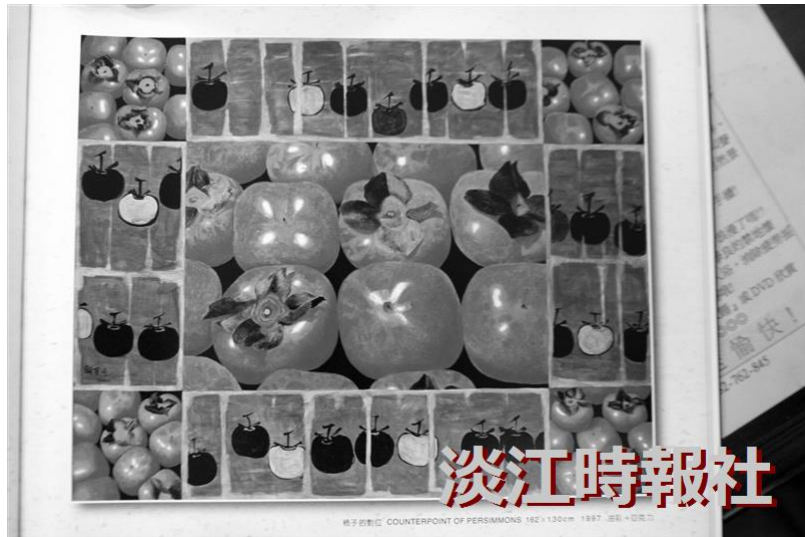
柿子的對位/顧重光