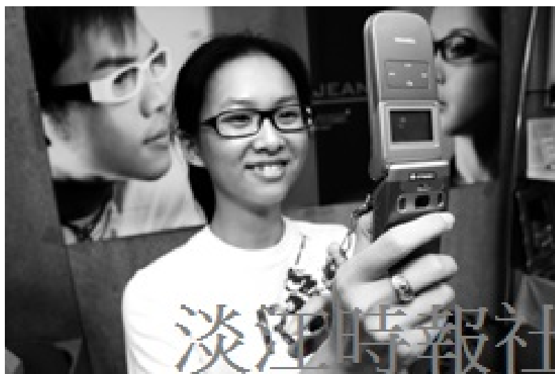
「社交高手」善用照相機及3G網路，成為交友及打擊罪犯的利器。