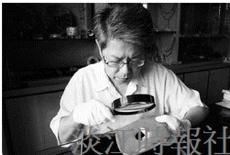
歷史文物研究室