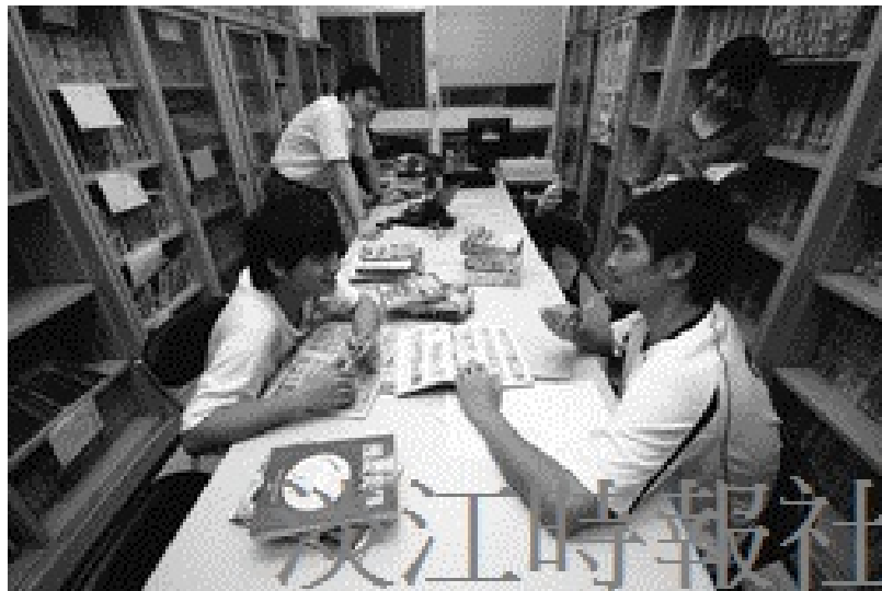
圖像漫畫研究室