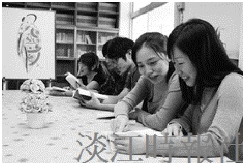
女性文學研究室