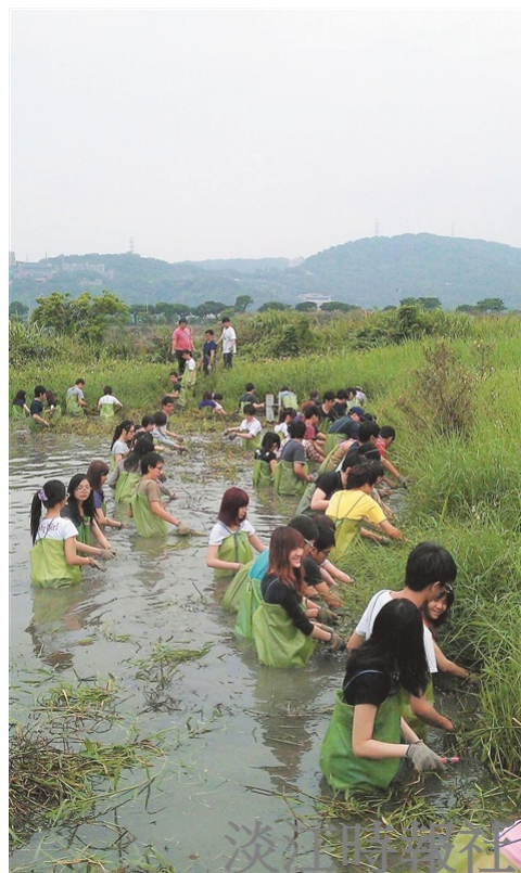
做環保救地球：淡江的學生在關渡自然公園擔任環境保育志工，割除雜草通河道