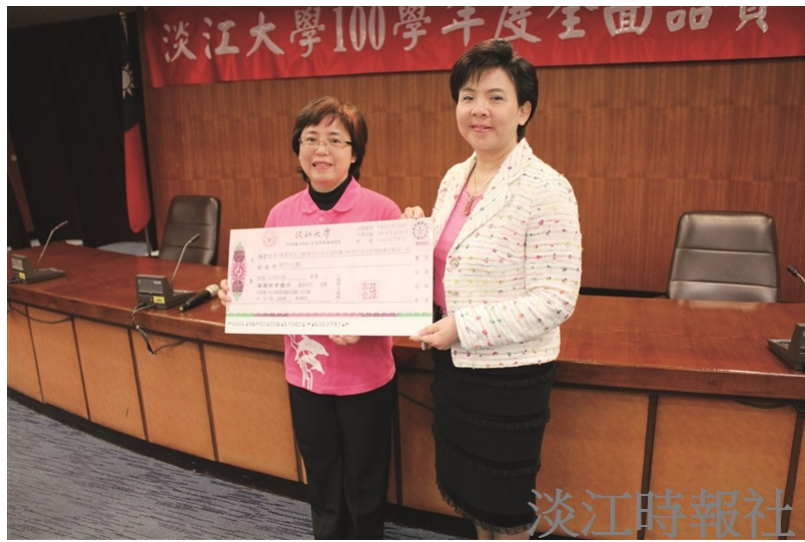
本年度品管圈冠軍圈ECO招才圈，由招生組與專案發展組共同組成。校長張家宜（右一）頒贈獎金及獎狀以資鼓勵。