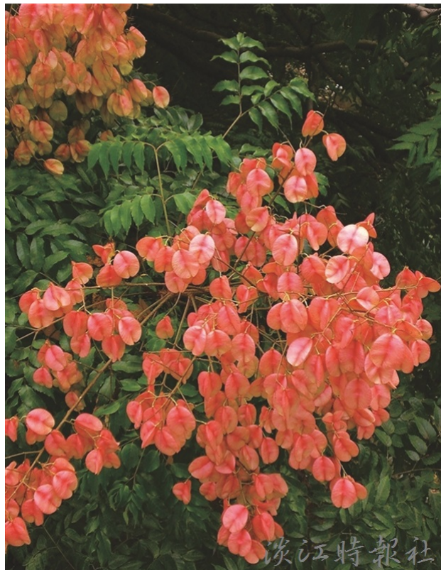
圖為紅色蒴果；操場及工學大樓可覓得花蹤。