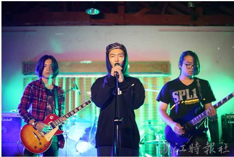
音樂文化社「搖滾吧飛Rock' n buffet」