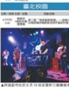
淡江大學音樂社在畢業典禮上表演，展現了對音樂的熱愛。