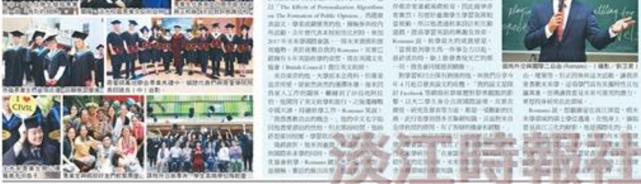
淡江大學外文與國際二自由課程，展現了學習新典範，猶如淡江三化縮影。

【記者陳明攝於淡江大學報導】淡江大學外文與國際二自由課程，展現了學習新典範，猶如淡江三化縮影。