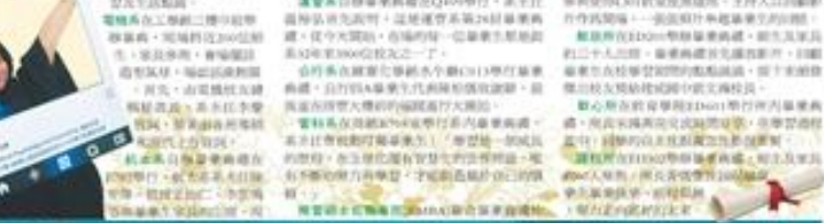
淡江大學財務金融學系畢業典禮現場。

淡江大學財務金融學系畢業典禮，日前在淡江大學圖書館舉行。此次畢業典禮由財務金融學系系所主任主持，場面莊嚴而熱烈。系所主任在致辭中勉勵畢業生要勇於承擔責任，不斷學習，為社會貢獻力量。畢業生們在典禮上發表了感人的畢業感言，感謝系所師長的悉心教導與友誼的陪伴。典禮在溫馨的氣氛中圓滿結束，師生們在話別中留下了難忘的回憶。