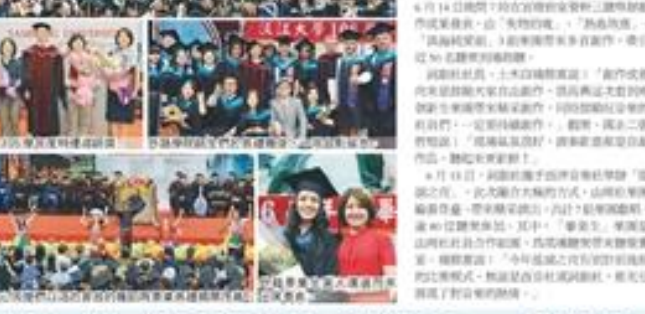
詞創攜手西音開唱搖滾之夜大鳴大放，吸引了眾多學生參加。

【記者陳明攝於淡江大學報導】詞創攜手西音開唱搖滾之夜大鳴大放，展現了學生對音樂的熱愛。