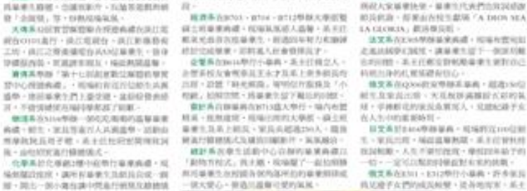
淡江大學財務金融學系畢業典禮現場。

淡江大學 38 系所自辦畢業典禮，日前在淡江大學圖書館舉行。此次畢業典禮由 38 個系所分別舉辦，場面熱烈，師生共聚一堂，共慶佳節。畢業典禮上，系所主任、教授、導師、家長、親友等親臨現場，為畢業生送上最真摯的祝福與鼓勵。畢業生們在典禮上發表了感人的畢業感言，回顧了在大學的點點滴滴，感謝師長的悉心教導與友誼的陪伴。典禮在溫馨的氣氛中圓滿結束，師生們在話別中留下了難忘的回憶。