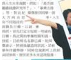
淡江大學 P 未來中心提供 1 對 1 諮詢服務。

【記者陳冠廷報導】淡江大學 P 未來中心，日前在淡江大學圖書館舉行 1 對 1 諮詢服務。此次諮詢服務由 P 未來中心專業人員提供，為師生提供專業、深入的諮詢服務。諮詢服務內容包括：學術研究、論文寫作、數據分析、軟體操作、實驗技術、職業發展、生活規劃等。專業人員將根據師生的具體需求，提供個性化的指導與建議。此次諮詢服務得到了廣大師生的踴躍參與，展現了 P 未來中心在支持師生學術與生活發展方面的積極作用。