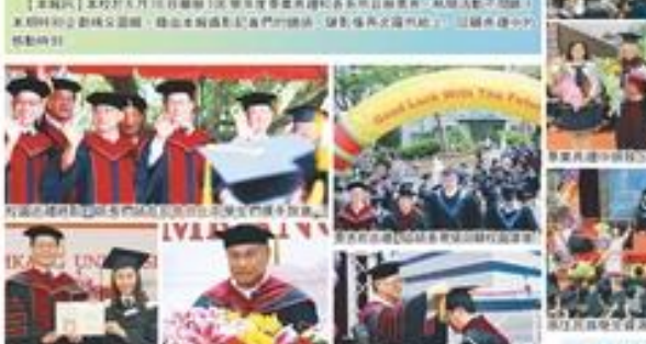
淡江校友在畢業典禮上與母校師生合影，展現了濃厚的校友情誼。

【本報訊】淡江校友於 6 月 16 日在淡江大學體育中心舉行校友手牽手活動，展現了校友對母校的熱愛。