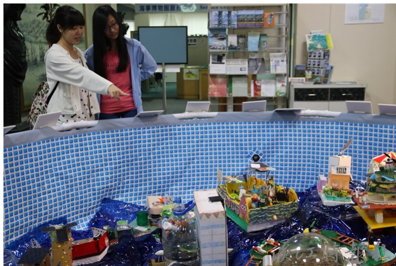
漂浮城市現蹤海博館 看見國中小創客精神