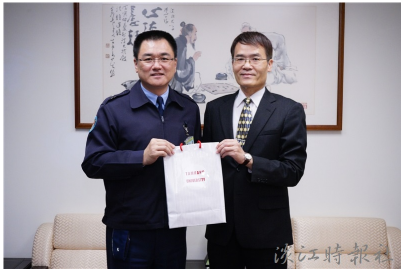
空軍作戰指揮部少將參謀長王德揚一行6人來校推廣人才招募。