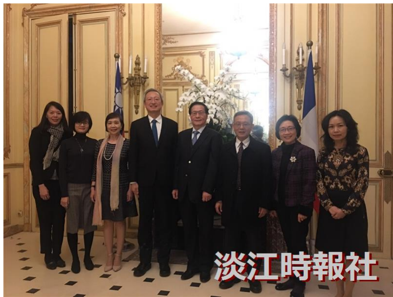
葛校長(右四)參訪團於3月11日受邀前往我國駐法代表處，由吳志中大使(左四)及外館人員接待。