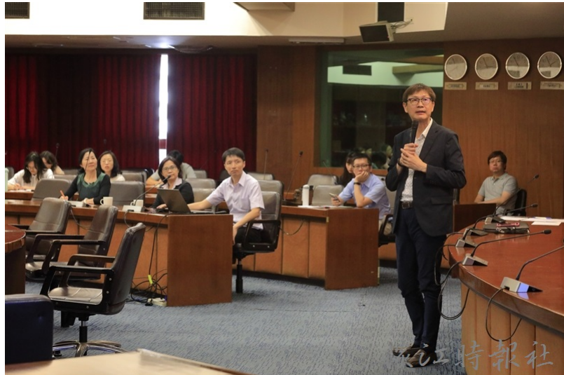
環安中心環安推動人教育訓練5月14日邀請台電公司發言人徐造華蒞校演講「電力大學堂」。