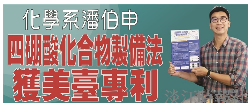
潘伯申研發四硼酸化合物製備法 獲臺灣及美國發明專利