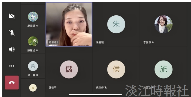
法文系於6月10日晚間6時舉辦線上第五屆微电影競賽放映會，因受嚴重特殊傳染性肺炎（COVID-19）疫情之全國第三級疫情警戒，系上師生和參賽共19人在Microsoft Teams中雲端交流。