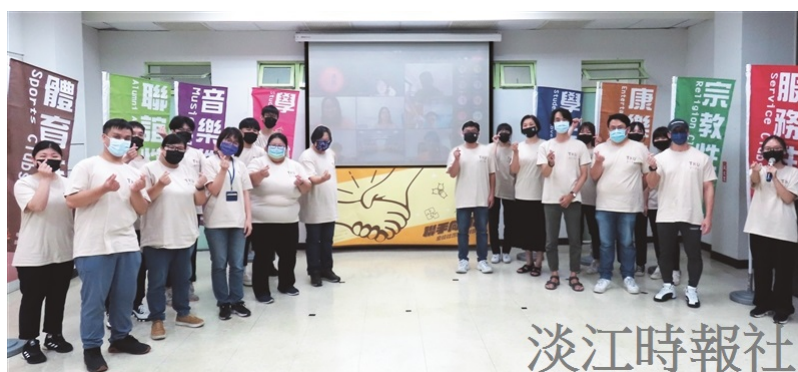
110學年度全校社團聯合幹部訓練9月8日至10日透過MS Teams方式舉行。