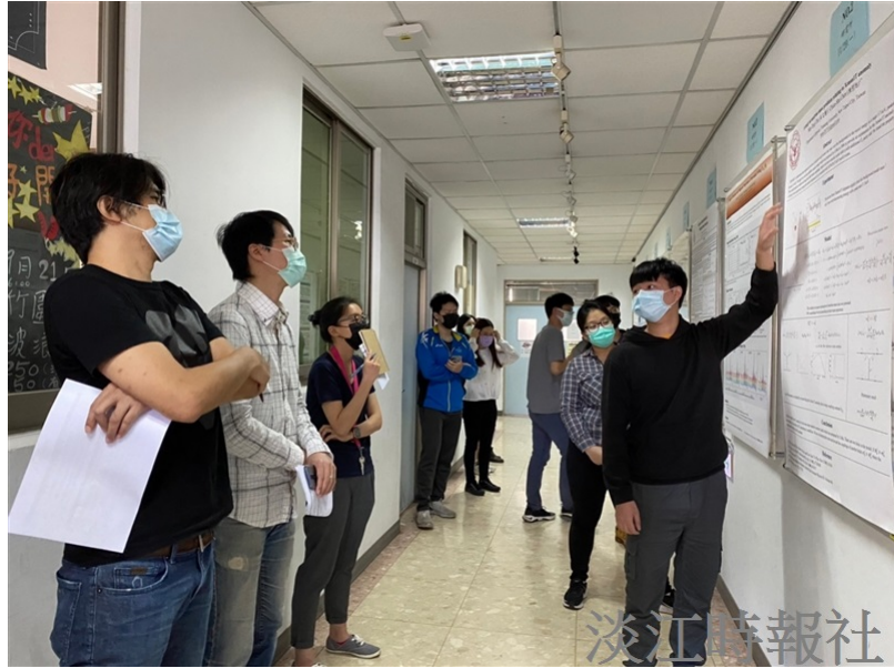
物理系舉辦物理週活動，同學以學術發表專題研究解說海報。