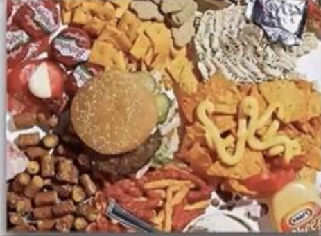
運動與營養 楊承祥 (宋賓)