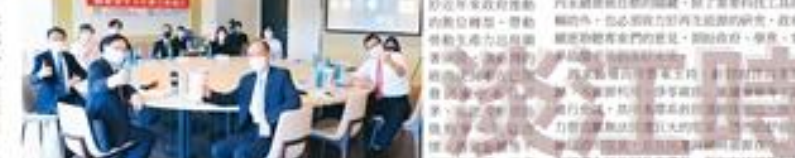
校長林全能出席國際永續發展論壇。

【淡江訊】淡江大學校長林全能日前在國際永續發展論壇中，分享其對永續發展策略的看法。他表示，企業在追求經濟效益的同時，也必須重視環境保護與社會責任。他呼籲企業界與學術界共同努力，推動產業創新，實現可持續發展。