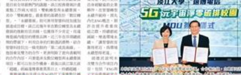
淡江大學與遠傳簽署MOU儀式。

【淡江訊】本校與遠傳攜手，共同打造5G元宇宙淨零碳排校園，開啟本校數位轉型新頁。雙方簽署合作備忘錄，內容包括5G元宇、元宇宙等領域之合作。遠傳董事長鄭淵表示，此次與淡江大學合作，是遠傳集團積極參與社會公益、回饋社會的具體表現。淡江校長張嘉良表示，此次合作將有助於本校在5G、元宇宙等領域的研發與應用，提升本校的數位競爭力。