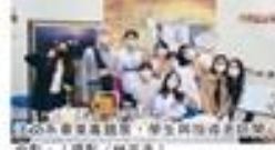
法文系畢業專題展。

【淡江訊】淡江大學法文系畢業專題展，日前在圖書館舉行。此次展覽展示了法文系學生在文學、藝術、音樂等方面的傑出成果。展覽吸引了眾多師生參觀，展現了法文系學生的才華與創意。