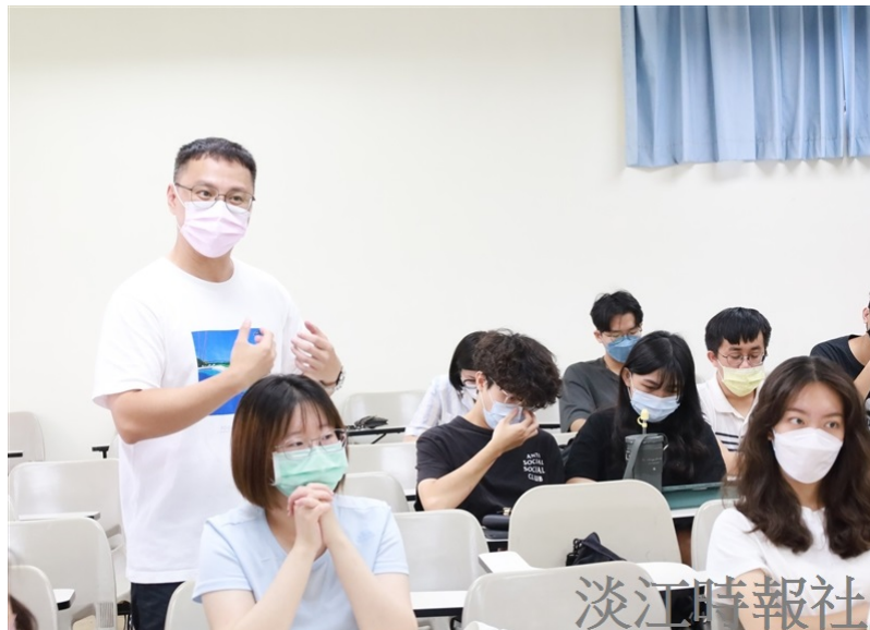
9/16 10:00~11:00在工館308教室舉辦 「都市計劃概論」講座