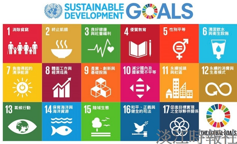
SDGs 17項目標。(圖／網路資料)