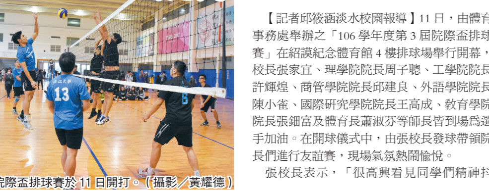
院際盃排球賽於11日開打。

【記者邱筱涵淡水校園報導】11日，由體育事務處舉辦之「106學年度第3屆院際盃排球賽」在紹謨紀念體育館4樓排球場舉行開幕，校長張家宜、理學院院長周子聰、工學院院長許輝煌、商管學院院長邱建良、外語學院院長陳小雀、國際研究學院院長王高成、教育學院院長張錫富及體育長蕭淑芬等師長皆到場為選手加油。在開球儀式中，由張校長發球帶領院長們進行友誼賽，現場氣氛熱鬧愉悅。 張校長表示：「很高興看見同學們精神抖擻，在院長們帶領下，將自己平時最好的表現拿出來。除了去年分別拿下男女排冠軍的商管學院與外語學院之外，其他學院也要再接再厲，期望同學透過比賽領悟團隊合作精神。」 外語學院院長、法文四劉紀廷說：「去年外語學院拿下第一，今年我們也會全力以赴把冠軍帶回來！」即日起至107年1月5日平日中午12時至14時，在紹謨體育館排球場展開為期近1個月的賽事，歡迎同學們到場為自己的學院加油。