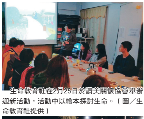
生命教育社在 2 月 25 日於讚美關懷協會舉辦迎新活動，活動中以繪本探討生命。

Excel 財務工具教學電腦初級與進階班外，也有中文會話班、中文職場班以及音樂與舞蹈教學的第二專長培訓班等。不僅帶給當地學子財務管理的基礎能力，也增加他們在中文對話的應用與才藝上的學習能力。 隊員、企管四李姿瑩分享：「我無法忘記課程的第一天，學生們認真、積極的眼神。從小就擁有豐富資源的我們，從不覺得需要珍惜，但對於他們，這些經驗都是特別的，即便中文不容易學，他們仍懷抱熱情在學習。這也讓我反思，該珍惜擁有的資源，且利用現有的環境，不再視其為理所當然。」 此次除了於東埔寨進行服務學習外，也至越南的凱薩衛浴、國泰人壽以及台北駐胡志明市經濟文化辦事處三個地點進行參訪，讓學生不僅能在服務中學習，也能了解不同國家的臺商企業文化，更豐富了海外志工行程。 林彥伶分享：「這是第二次到同一個地方服務，熟悉且愉快，也讓我們再思考可以多給他們什麼。同時，由於我們到東埔寨時有過境越南，趁機也安排了三個臺商企業的參訪活動，讓學生能夠了解海外市場生態以及更知道未來是否朝向這方面發展。」