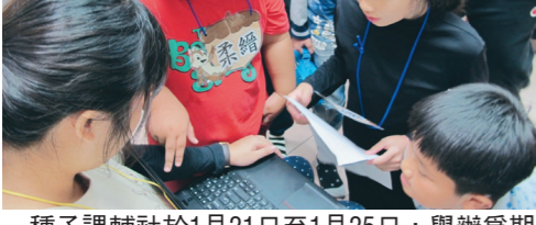
種子課輔社於 1 月 21 日至 1 月 25 日，舉辦為期 5 天的「羅吉的異想世界大冒險」營隊，以資訊教育作為發想，設計闖關遊戲啟發學習。