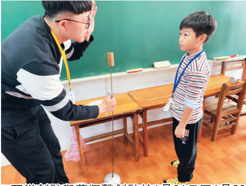
西泮劍社與蘭翔擊劍社於 1 月 21 日至 1 月 23 日，至淡水區水源國民小學，舉辦擊劍成長營「劍劍喜歡你」，圖中為服務員教學員擊劍測重方法。