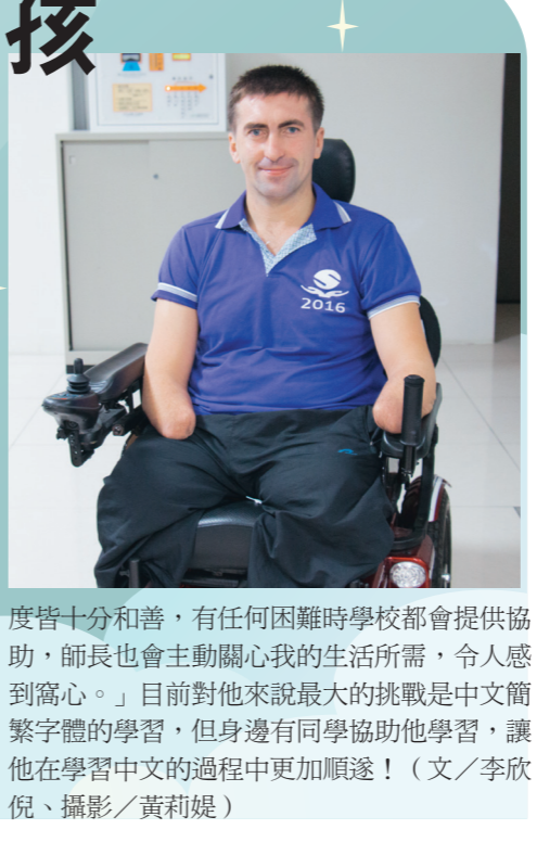
度皆十分和善，有任何困難時學校都會提供協助，師長也會主動關心我的生活所需，令人感到窩心。」目前對他來說最大的挑戰是中文簡繁字體的學習，但身邊有同學協助他學習，讓他在學習中文的過程中更加順遂！（文／李欣倪）