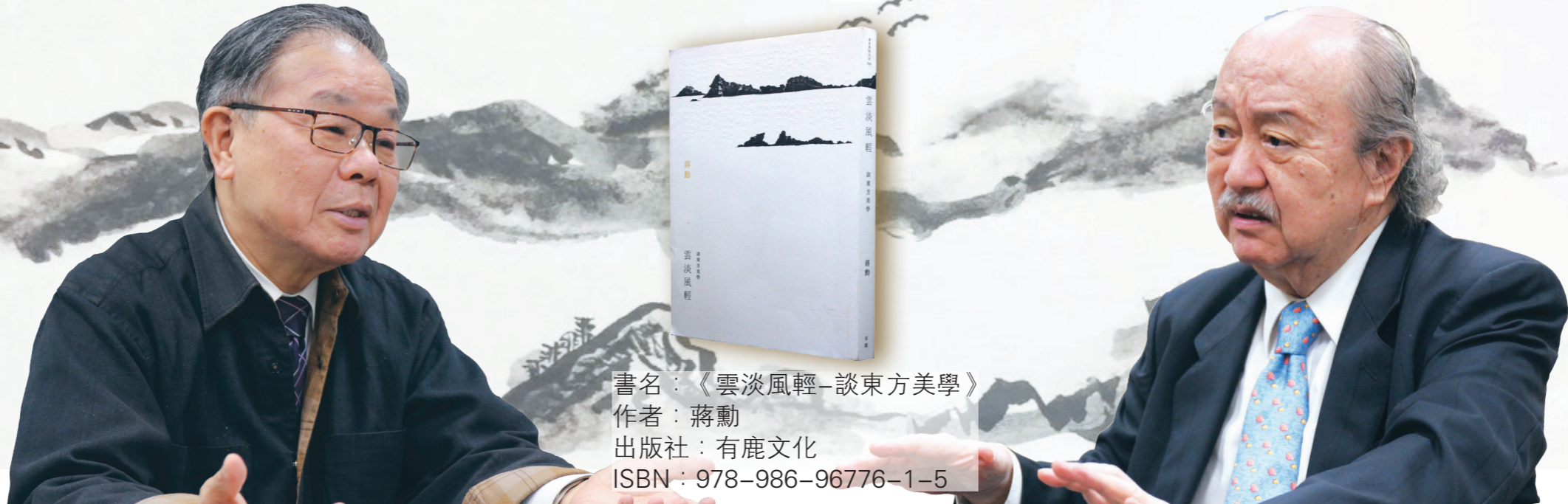
書名：《雲淡風輕-談東方美學》 作者：蔣勳 出版社：有鹿文化 ISBN：978-986-96776-1-5