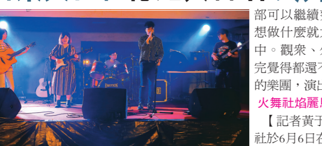
音樂文化社於6月6日在體育館1樓社辦廣場舉辦期末成發《憶起》，由社員組團輪番上臺，演唱18首歌曲。