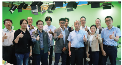
▲早稻田大學教育研究服務的學術解決方案公司蒞校參訪。

研討會邀請了外交部大使陳剛毅及國防安全研究院董事長霍守業致詞，展現淡江戰略所與外交、國防安全以及國家智庫方面深入交流。