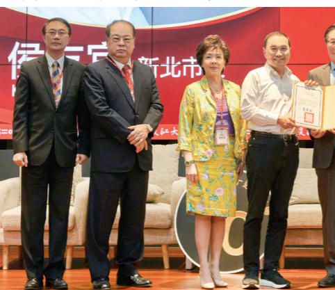
▲大傳系創系 40 週年，邀請新北市長侯友宜 (右四) 蒞臨「跨越與永續：人才培育論壇」。

【記者黃茹敏淡水校園報導】大傳系慶祝創系 40 週年，於 5 月 26 日下午 2 時在守謙國際會議中心有連廳，舉辦「跨越與永續：人才培育論壇」。董事長張家宜、校長葛煥昭、新北市長侯友宜、校友總會及系所友會聯合總會會長林健祥與莊子華及大傳系校友、師生逾 350 人參與。