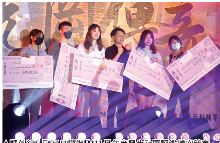
▲課外組5月27日舉辦的111學年度學生社團評鑑檔案競賽頒獎典禮時獲獎社團開心地上臺領獎。

【記者鄧晴淡水校園報導】課外活動輔導組5月27日在學生活動中心舉辦「111學年度學生社團評鑑檔案競賽」，總計131