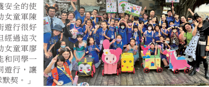
▲本校稚齡童軍團設計可愛車體造型，參與 2023 淡水藝術嘉年華踩街活動。

【記者王薇婷淡水校園報導】經濟系與「經探號」團隊於 10 月 14 日上午 8 時 30 分至 12 時進行「觀音山健走 + 淨山」活動，由教授兼品保處稽核長林彥珍帶領 22 位同學，廣邀全校師生及教職員工參與，共計 23 人熱情參與，響應環保的同時更透過健行以促進健康。