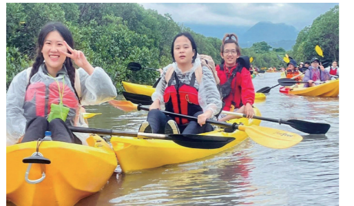
▲淡水上划獨木舟，體驗從不同視角認識淡水的地理景觀。

上獨木舟練習划槳，然後一路行經關渡宮，在眾多和平鴿的天空下，駛入紅樹林及關渡水鳥保護區，感受天地一沙鷗的視野，及悠遊穿梭在自然生態的趣味。過程中，雖然有同學不小心落水，幸好有穿上救生衣及做好心理準備，沒有太過驚慌，反而克服了對大自然及水性的恐懼。