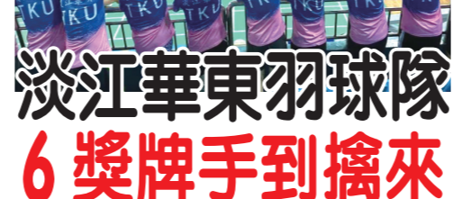
▲淡江華東羽球隊成員合影。

【本報訊】本校大陸華東校友會TKU羽球隊10月27日至29日，參加2023南京高淳臺胞羽毛球城市邀請賽，是場全場唯一的臺灣高校校友隊，12名團員與來自南京、上海、昆山、廈門、臺灣新北等地，180餘名臺灣同胞齊聚高淳，校友們勇奪6面獎牌，包括男單冠軍、亞軍、殿軍，中年組男雙冠軍，青年組男雙亞軍和中年組混雙亞軍，旗開得勝，滿載而歸。