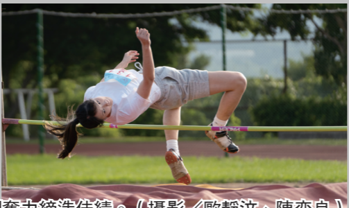
▲體育處11月1日舉辦校慶運動會，選手們奮力締造佳績。（攝影/歐靜汶、陳奕良）

【記者高瑞好淡水校園報導】73週年校慶運動大會於11月1日上午10時，在紹謙紀念體育館7樓舉行，首先登場的是趣味競賽，下午則在運動場進行田徑賽，選手們