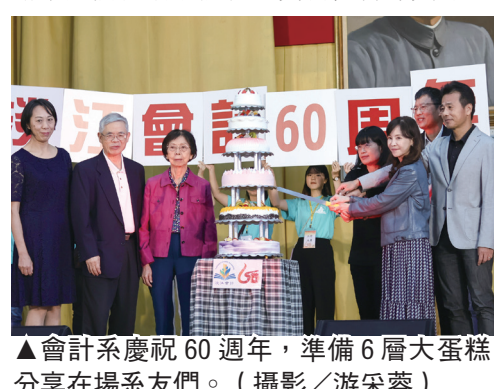
▲會計系慶祝60週年，準備6層大蛋糕分享在場系友們。

張董事長指出，會計系歷史悠久，歷年來系友在各自崗位努力付出，發光發熱。葛校長表示，今天場面盛大，祈願會計系如本校發展目標一樣「永續」，繼續發展超越兩甲子，讓現場系友歡聲鼓舞。方郁惠致詞提及，超過12,000名優秀系友在各行各業，走過這一甲子不容易，感謝系友們長期予捐款、實習機會等資源。