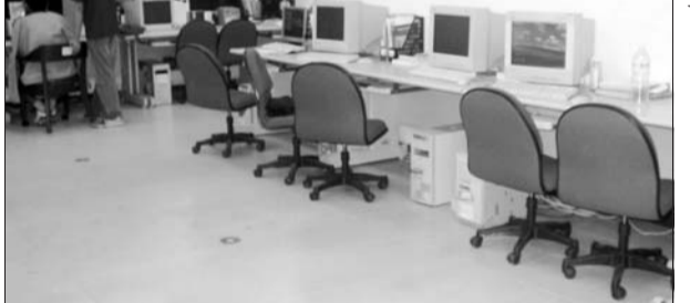
實驗室在重新規劃之後, 空間變得寬敞舒適。

把實驗室及研究室分開, 規格和型式都變得舒適, 以前還合併在一起時, 顯得雜亂, 現在連窗戶全都透明化了, 整潔許多!