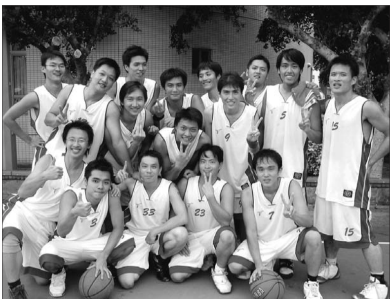
▲陸研所男生們在賽前努力練習，讓他們默契十足，獲得新生盃男籃賽冠軍，寫下13年來第一次研究生稱王的紀錄。

參加新生盃的系所男子組共有42隊，女子組有24隊。今年男籃前四強分別為陸研、化材、土木、產經。女籃前四強則是歷史、決策、中文以及會計。