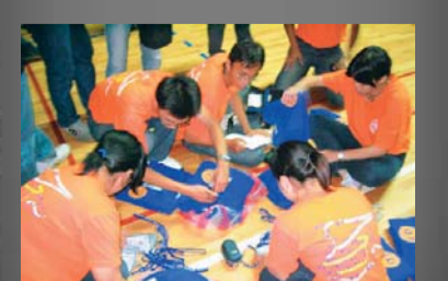
為了把活動辦得盡善盡美，學員正努力趕工。