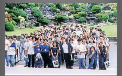
學員在福園前留下美麗的背影，成為永恆的回憶。