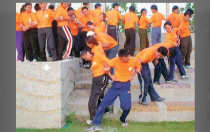
學員在活動中學習團體生活。