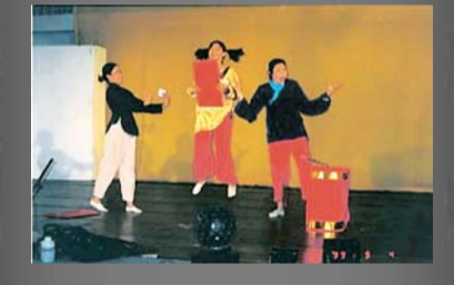
學員在晚會上載歌載舞，表演生動活潑。