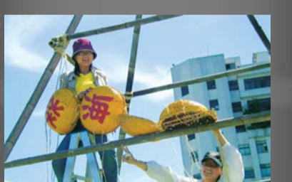
工作人員正在蛋捲廣場架設象徵淡海同舟的精神堡壘。