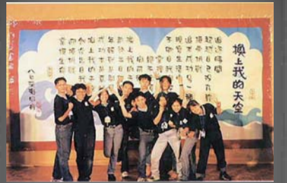
同舟會後，學員們興高采烈地在海報前合影。