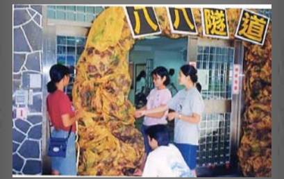
因為是88學年淡海同舟，所以特地以「八八隧道」為佈置主題。