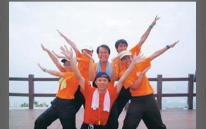
學員感情十分融洽，要實地在鏡頭前留下珍貴回憶。