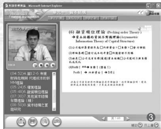
圖1/舉辦「清潔日」活動為創造共好校園的實踐。圖2/邀請台北教育大學校長莊淇銘演講，指導學習方針。圖3/網路教學為本校推展方向。圖4/邀請義大利知名男中音理查·李特曼來校演講，以活化通識教育。圖5/國際留學生品嚐粽子，增進對台灣民俗、飲食的了解。

文/學術副校長馮朝剛 編者按：教育部95年度獎勵大學教學卓越計畫結果公佈，本校獲8400萬補助，成績亮眼。此次共有85所學校獲得補助，年度經費擴增為50億元。本報特別刊載學術副校長馮朝剛對於本校教學卓越計畫的論述，期使師生了解本校未來走向。