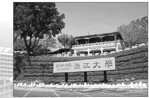
淡江大學校園風景