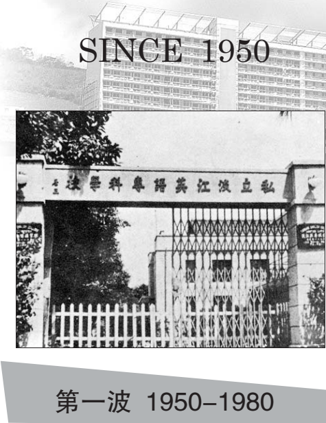
淡江大學校門及校園建築