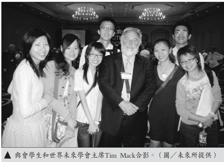
與會學生和世界未來學會主席Tim Mack合影。