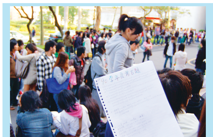
上週為本校期中考週，一大早圖書館還沒開門，門外就已經排滿人潮，同學在等待時還不忘拿出考古題猛K，十分認真。隊伍綿延數十公尺，與百寶週年度排隊人潮不相上下。

而本學年度大一、研究生求助的比例增加，胡延薇表示，這些新生大多面臨壓力管理問題，諮輔組在經過初步的晤談後，找出困擾學生最主要的癥結點，並安排專業的心理輔導老師加以輔導，嚴重者則轉介給駐校精神科醫師。