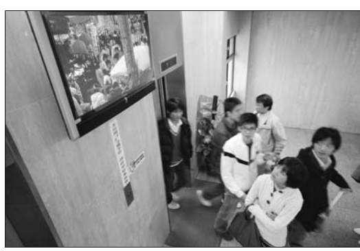
▲裝設在商館電梯前的液晶電視，每天播放不同主題的影片，師生等電梯時不但不覺無聊，還可以利用時間增長見聞。