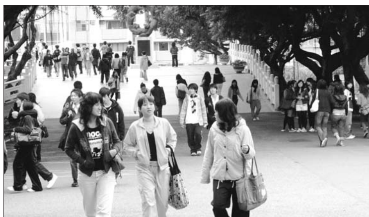
▲禁行車輛的文館前小步徑，上、下課同學放心在此步行、聊天，無後顧之憂。

說到校園美化，絕對不能忘記象徵淡江精神的書卷廣場，四片不對稱的白色竹卷，以瀟灑的姿態佇立，不論是藍天、黃昏或夜晚，都呈現出不同的迷人景致。由本校校友林貴榮建築師所設計的書卷廣場，除了象徵著淡江樸實剛毅的治校精神，也因其造型而有一個奇妙的外號「蛋捲廣場」，四周一片如茵的草地，白線相間令人曠神怡，經常有同學來這裡討論作業、談心閒聊，許多社團聚會或校內大型活動也會在這裡舉行，更是每位淡江人拍畢業照時少不了的景點。