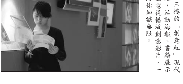
▲文館三樓的「創意紅」現代感十足，活動海報、書籍展示而論給你知識無限。