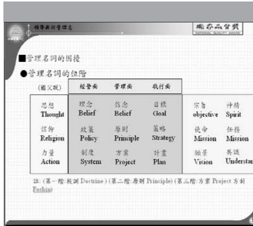
▲(圖一)以「國父說」解釋管理名詞的涵義。

A：家長是外部顧客，但學生畢業後身分改變，所以可以是內部顧客，也可以是外部顧客；而老師及行政人員則是內部顧客，也應好好照顧。基本上，學校顧客的分類沒有一定的標準，只是強調不要忽略每一位顧客。