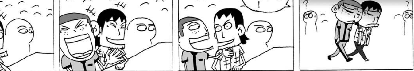
「終於站淡水到了,下車時請記得隨身攜帶的物品。」是呀,這次春節,我的確回來不得了的東西,超過我能容納的大多。「沒關係的。」是向學校的路上我這麼告訴自己:「反正,都是回家的路。」

臨走前,她給我兩個自家榨煉的紅龜粿。這在小時侯外婆做了一次,而我連嚼也不嚼的嚼。