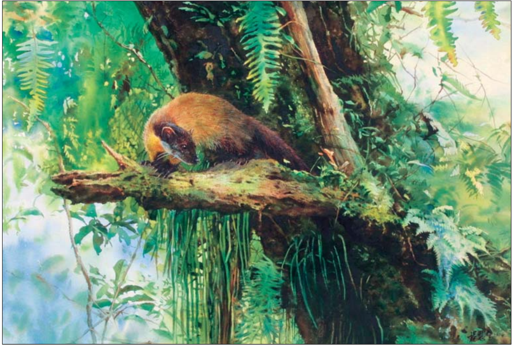
▲「黃臉猴」為「台灣的森林水彩特展」展品之一，是國際知名水彩畫家楊國生的作品，其展出主軸之一是森林與生態，呈現森林豐富的珍稀動物，希望喚起國民理解環境與生命的關聯，而更重視生態保育。本展展期至7月20日。