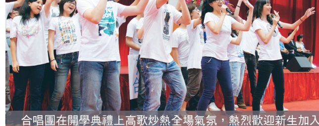
合唱團在開學典禮上高歌炒熱全場氣氛，熱烈歡迎新生加入淡江大家庭！