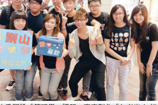
▲土木系開設「管理學」課程，專案製作「仁者樂山能者樂善」的團隊齊聚街頭募款。