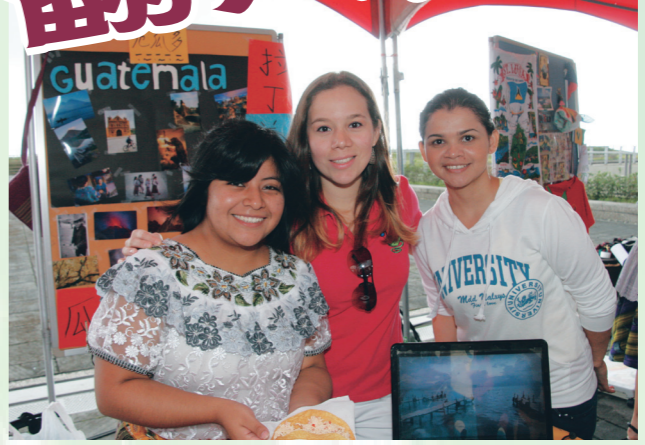
蘭陽校園新成立的外籍同學聯誼會在園遊會中穿著傳統服飾，以風味小吃吸引眾人目光。